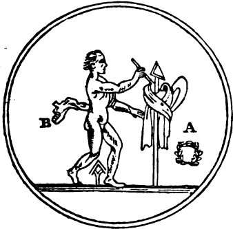
TROPÆUM AB ALEXANDRO STATUTUM:

que ἀρόρος locutum, ut et Herodianum, ubi urbem ad Issum exstructam tropæum Alexandri improprie nominat. Suffragatur Siculo et Herodiano etiam Philostrate. de Vita Apollon. lib. II. extremo, qui disertissime aræ triumphalem apud Indos ab Alexandro erectum, ubi Porum vicit, testatur. Freinskh.