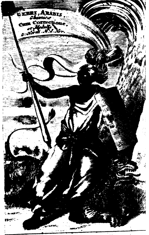
Apud Arnoldem Donde 1668.