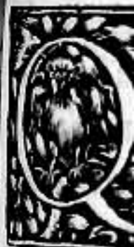
figura stella propter qu circundant postea uarie met attraher est, assimil compertum idem maxim primum ita primum eff ultimum ec perfectior pr pelleret, secu quæ, dum in sunt in hom hora partus est qualitat circundantis tum moueri tur, ut stellar existimemus fici assimilac solerti tramit prognostican

na, stella ia uero n quos & c cidentiū plemento in quibu re figurar mus, imo in toto u ipfis rebu nuntur, r las, quæ m multa pri ia nobis, r circundan perueniū per quom prehendu ed dimin mus, addi