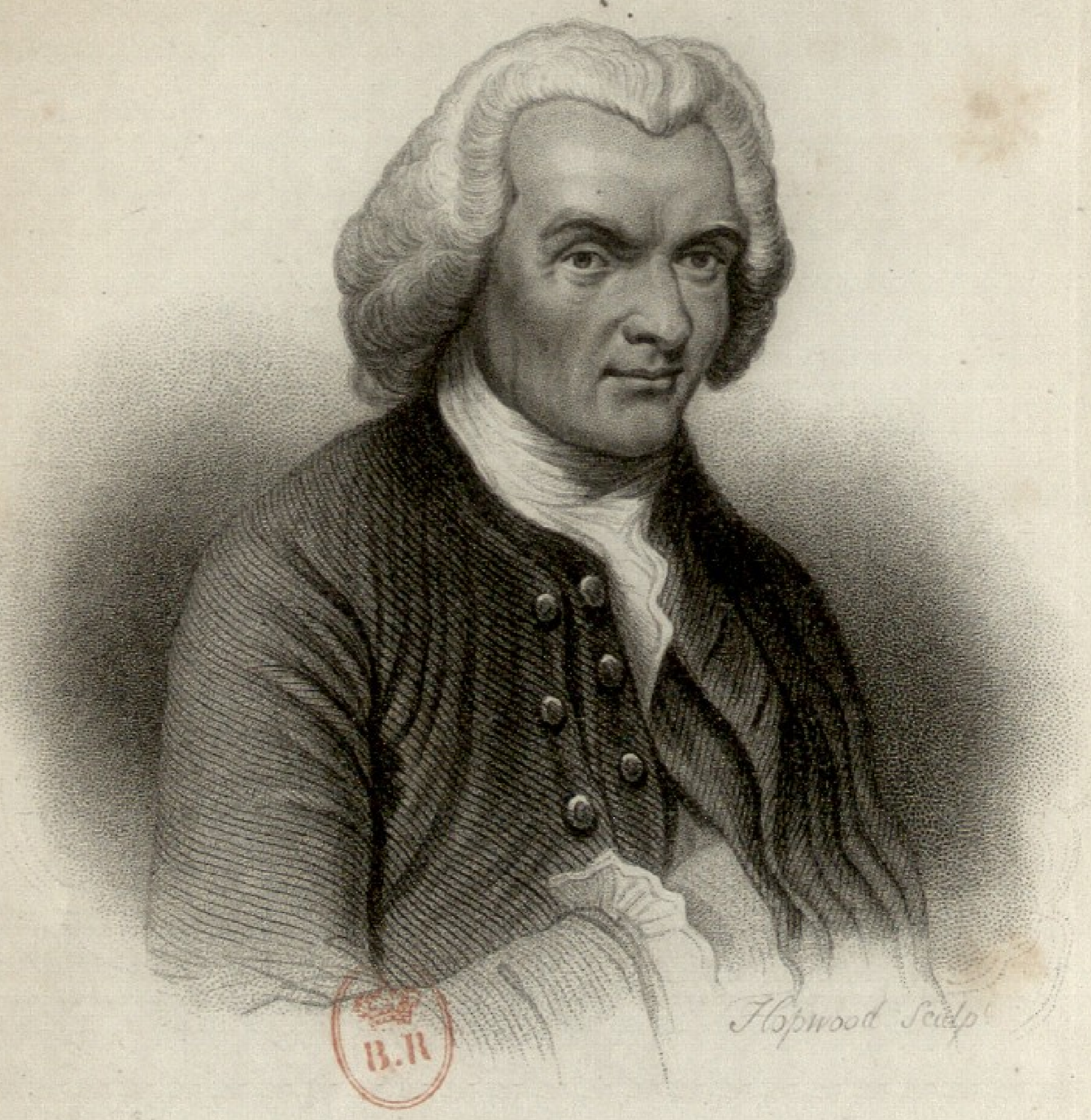
J. J. ROUSSEAU.