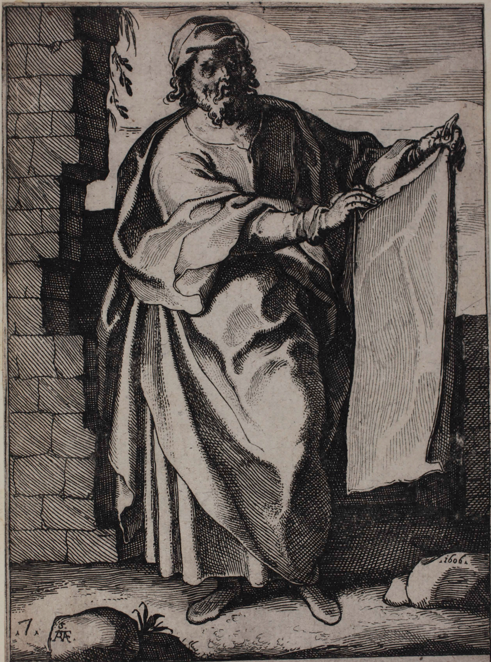
14 OSEAS PROPHETA.