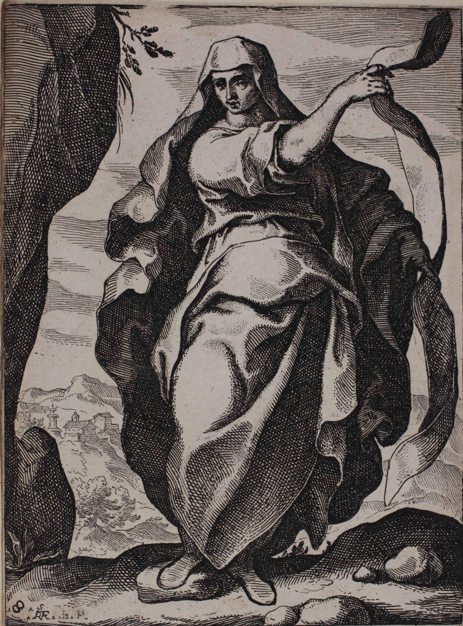
30 SIBYLLA HELLESPONTICA Progenies summi speciosa uera tonantur.