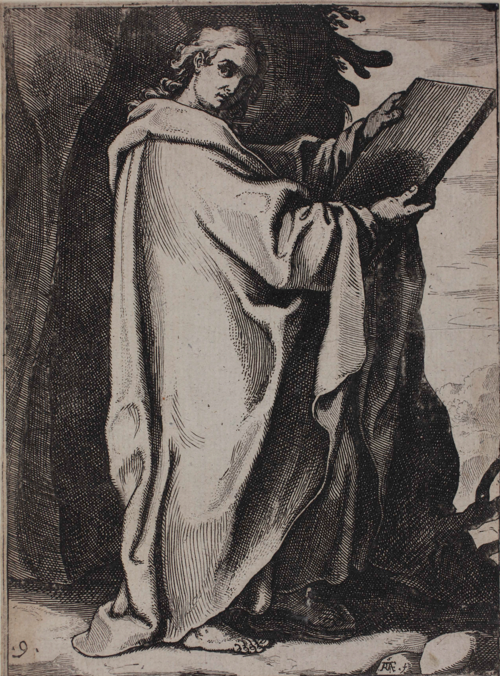
10 DANIEL PROPHETA