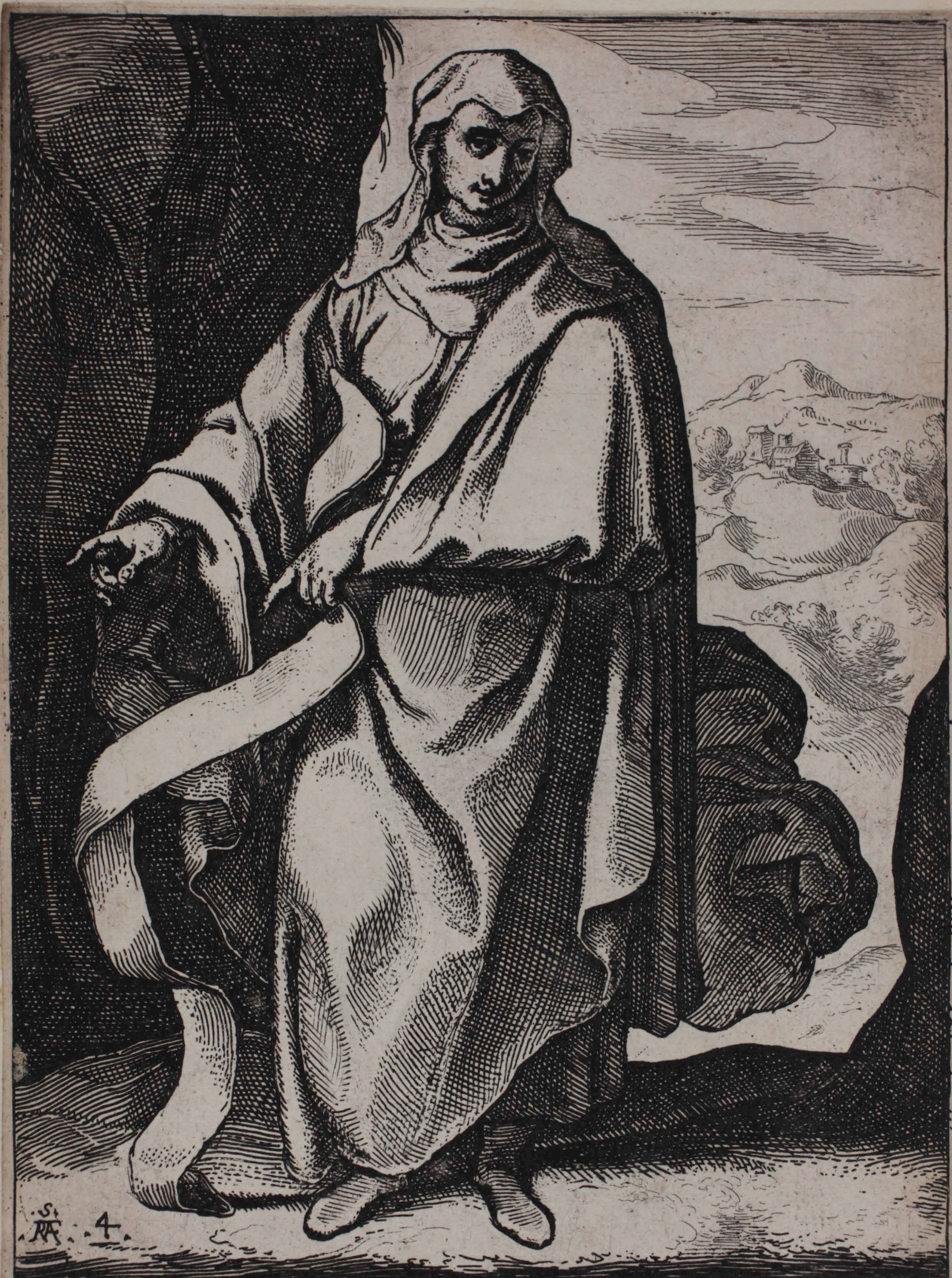
30 SIBYLLA PERSICA Virgine matre satus pando residebit asello, incundus princeps, unus qui ferre salutem rite queat lapsis