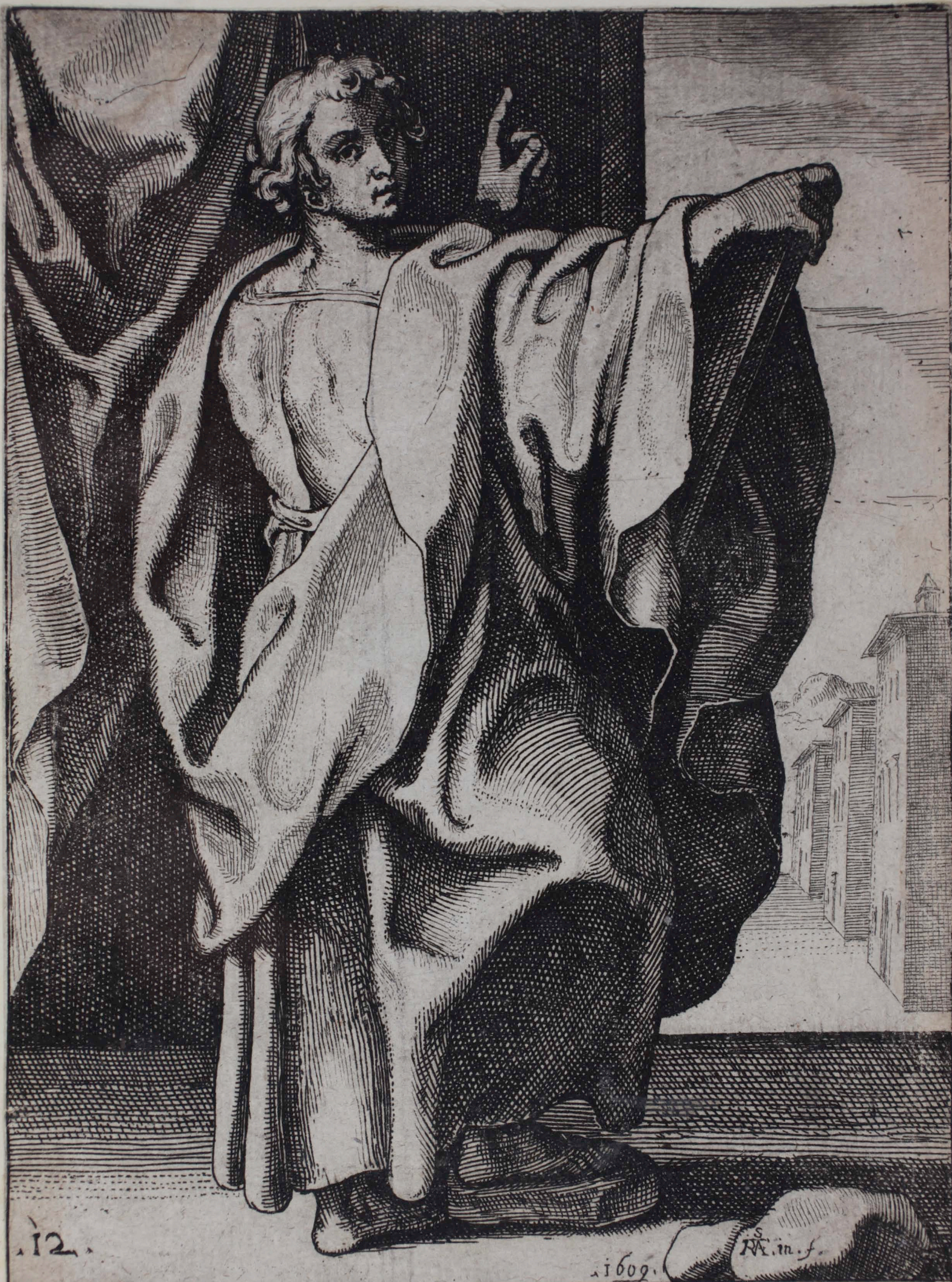
22 AMOS PROPHETA