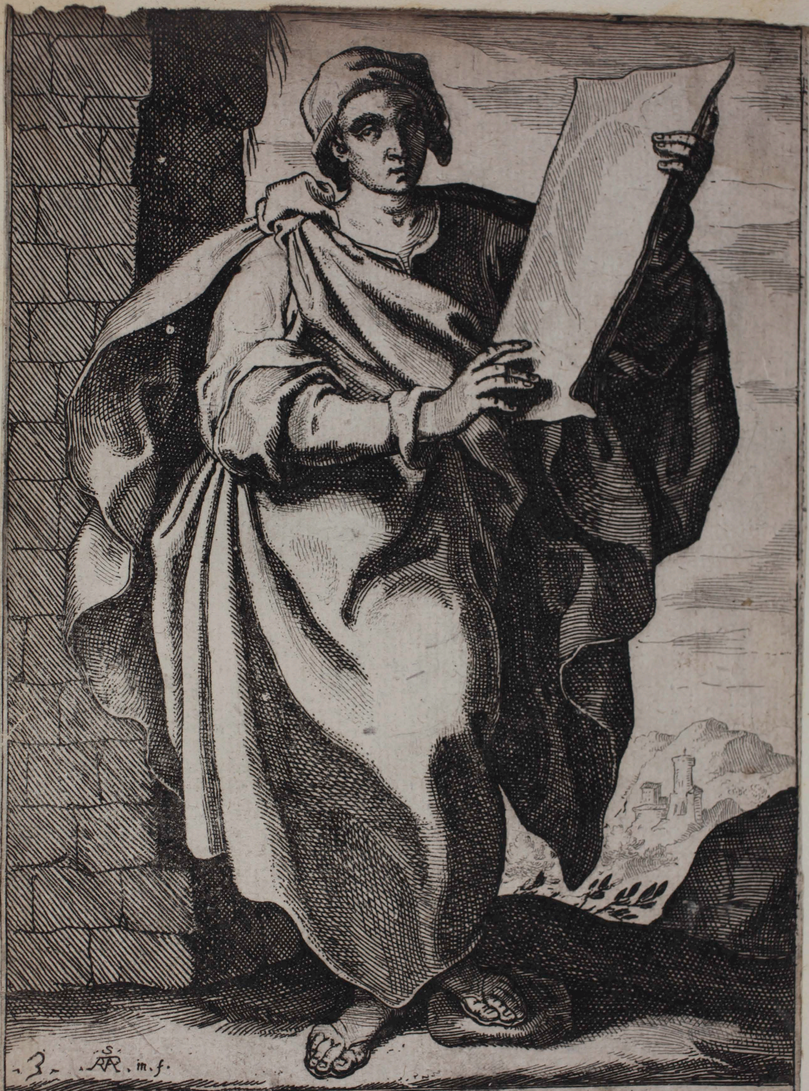
100 ZACHARIAS PROPHETA