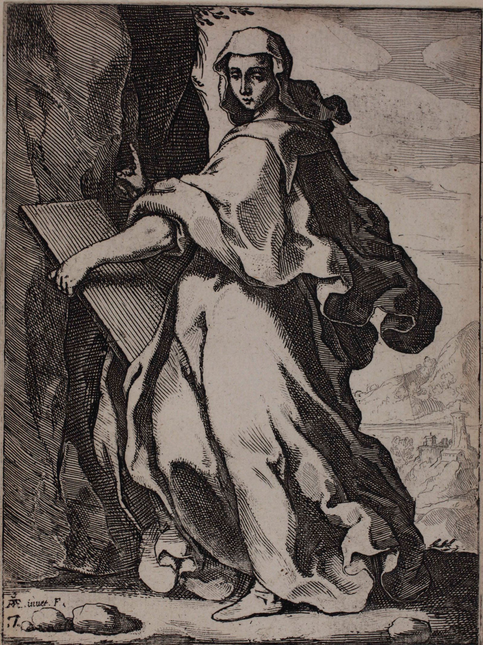
36 SIBYLLA CVMANA Toti ueniens mundo cū pace placebit ut uoluit nostra uestitus carne decenter.