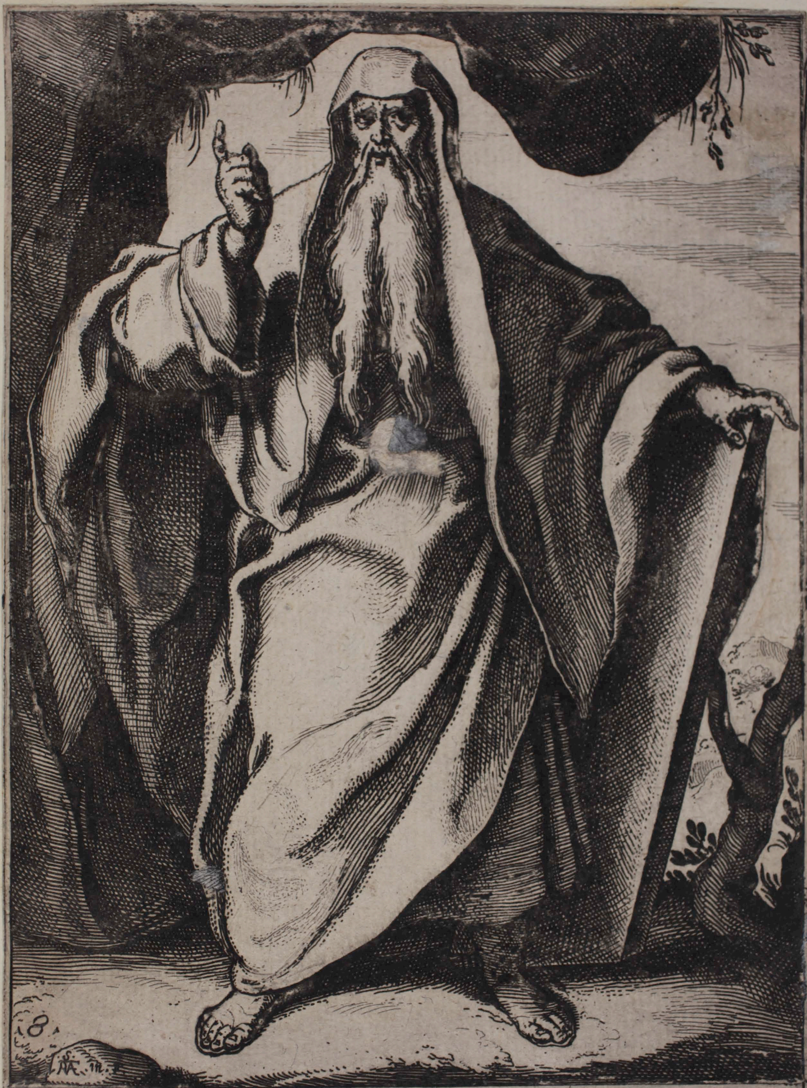
4 ISAIAS PROPHETA