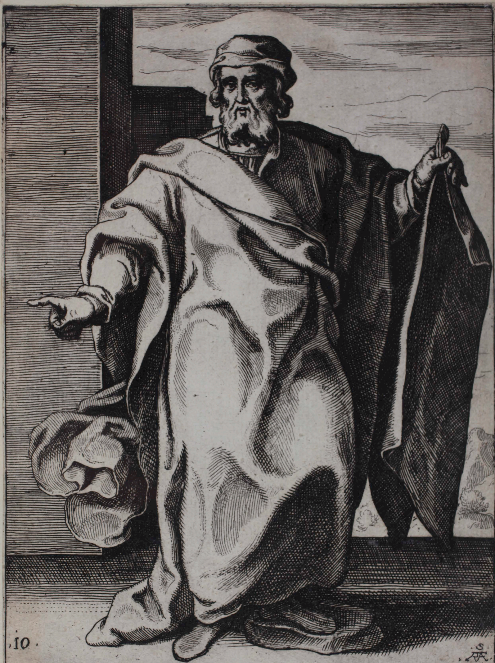
20 IOEL PROPHETA