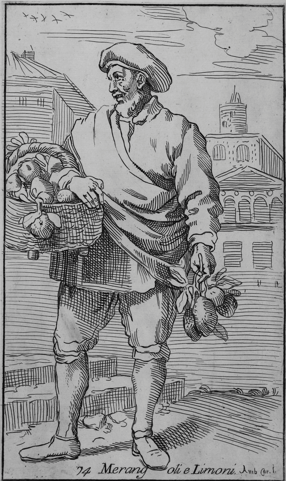
74 Merang oli e Limoni. Amb. Car. I.