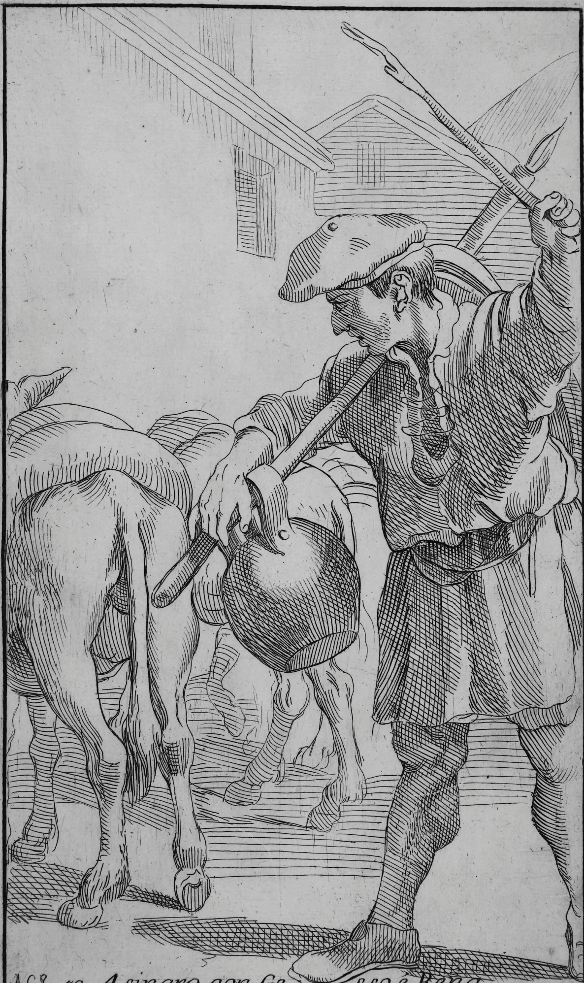
269 59 Asinaro con Ge sso, è Rena.