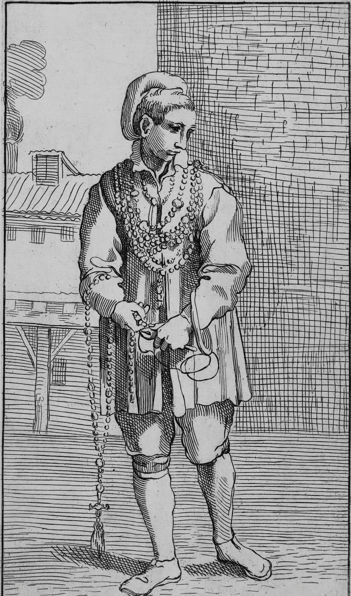
61 Incateneratore di Corone