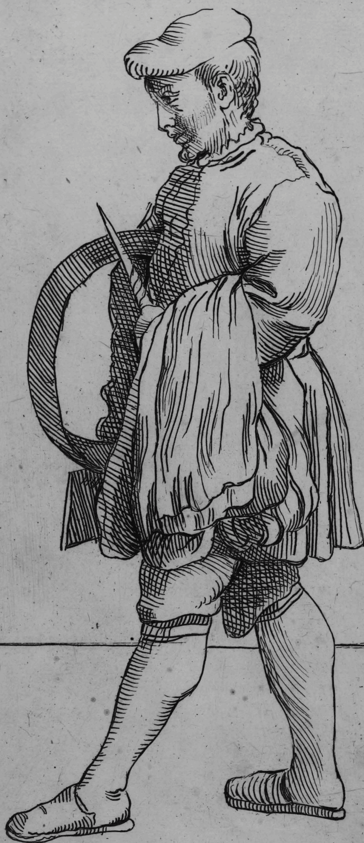
34 Burattator di Farina.