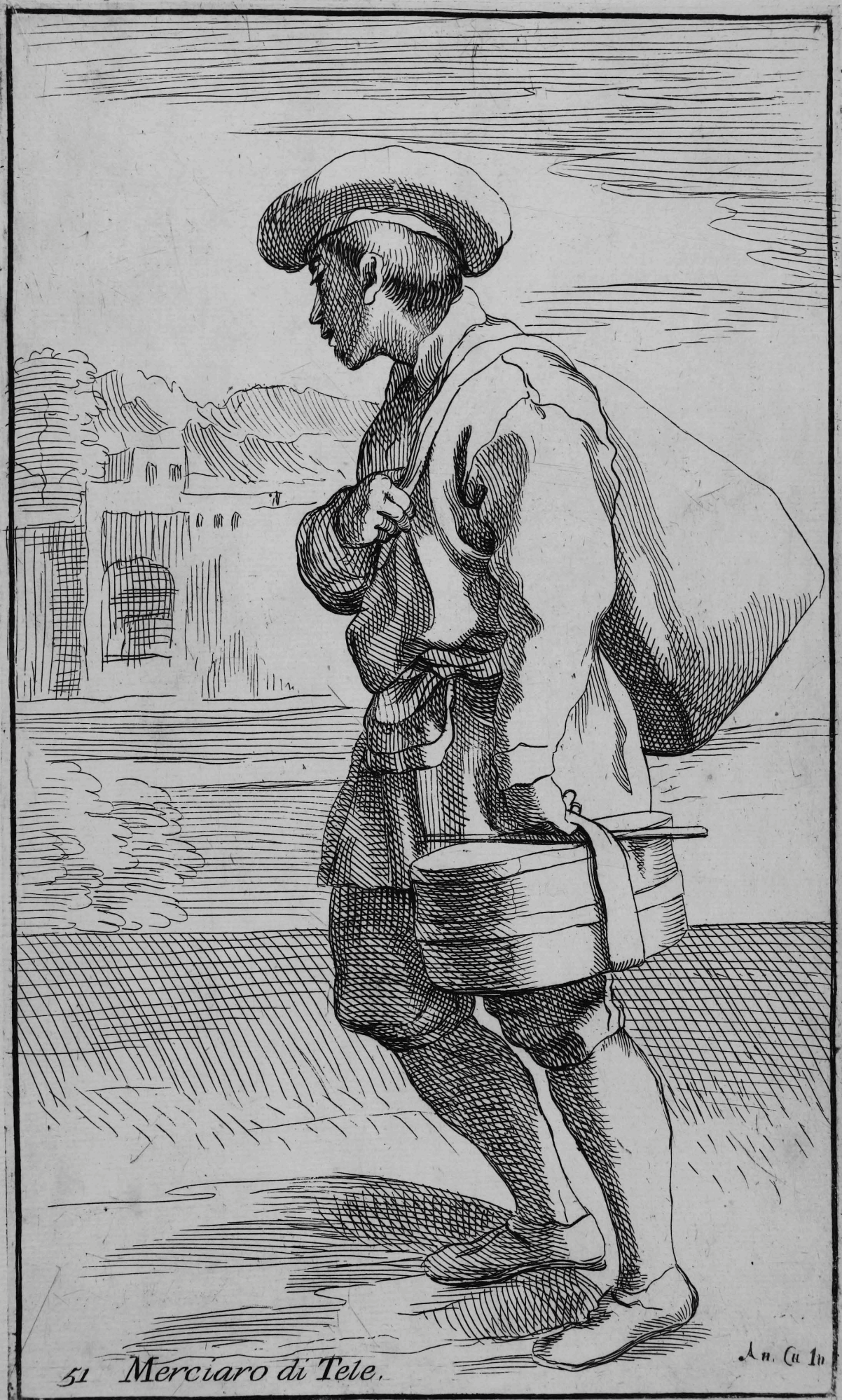
51 Merciario di Tele.