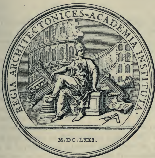
MÉDAILLE COMMEMORATIVE DE LA FONDATION DE L'ACADÉMIE.