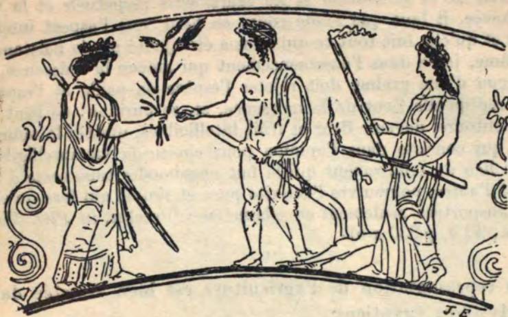
TRIPTOLÈME EN LABOUREUR Vase de style béotien à figures rouges.