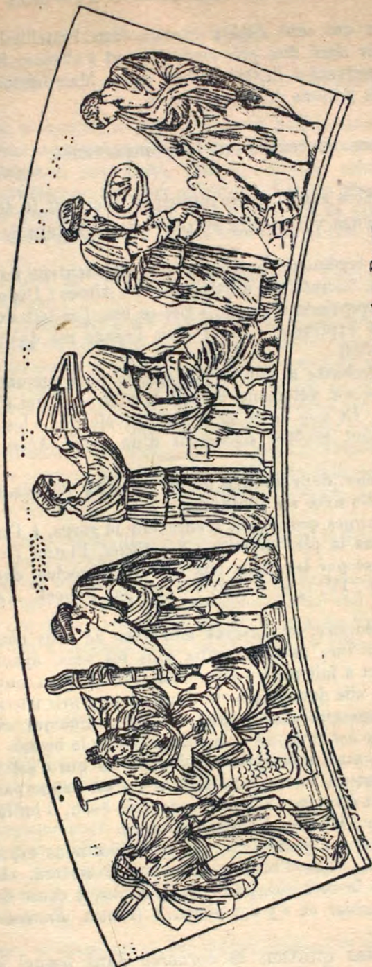
RELIEF SCULPTÉ SUR UN VASE DE MARBRE TROUVÉ A ROME. (Daremberg et Saglio, Dictionnaire des antiquités grecques et romaines , Hachette éditeur).