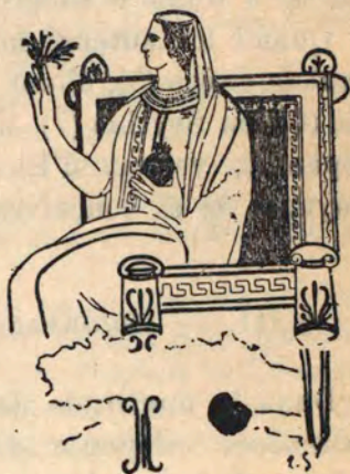
PERSÉPHONE TENANT LA GRENADE

Des Mystères très célèbres furent fondés en Messénie, à Andania, par Caucon d'Eleusis, perfectionnés plus tard par