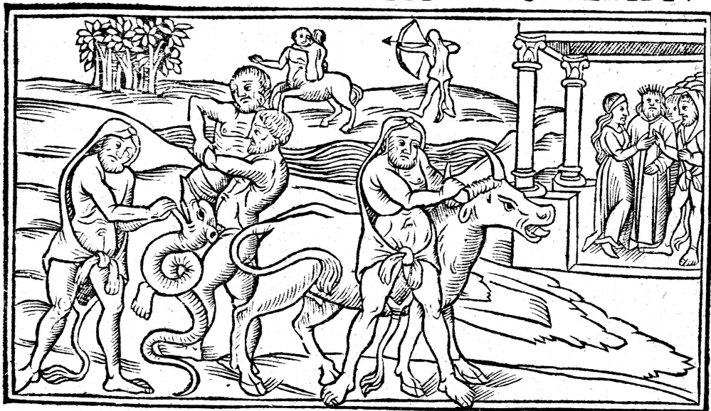
Fig. 1. Ovid's Metamorphoses, Book 1, Line 100.