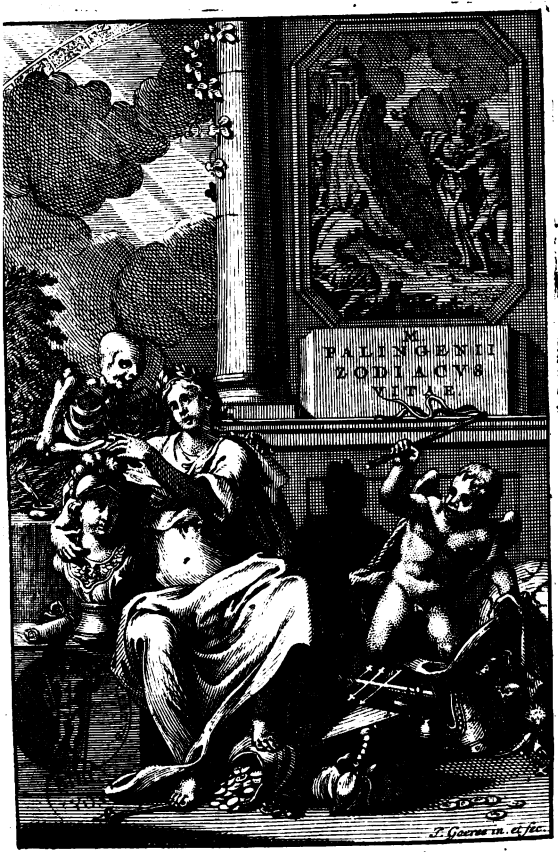
ROTTERODAMI, apud J. HOFHOUT. 1722.