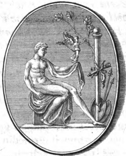
ACHAT : INCIS :

AUGUSTUS capite & corpore nudus , cum humero dextro linteo tantum operto , cippo infidens , dextrâ ejusdem lintei parte involutâ , victoriolam sustinet alatham , quæ finistrâ dimissâ ramulum abscissum tenet , dextrâ verò elatâ cum corolla ramum apprehendit majorem , medio columnæ , unâ cum arcu & pharetra transversim alligatum , eminet autem globus super eandem columnam , ante Augustum erectam , in congerie armorum , in Achate diaphano , alt. 2 \frac{1}{2} poll. lat.