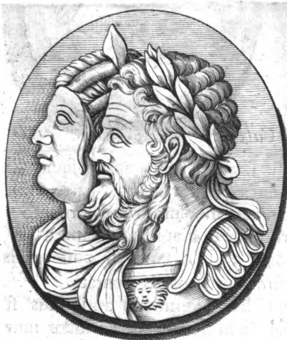
Onyx Varieg: exc.

paret ex eo quod hæc gemma fuerit & adhuc extet, tam perpendiculariter, quàm transversim, per medium spissitudinis sufficienter perforata, ut per hæc foramina ferro signi firmiter infereretur, dentatam verò in circumferentia fuisse arbitramur ut solidiùs circulo gemmam ambienti adhæreret.